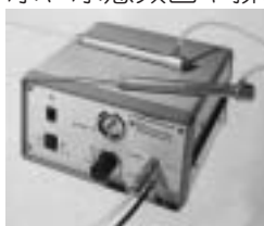
リトクラスト (空圧式結石破碎装置)

膀胱結石は、日常診療において、しばしば見られる尿路結石の一つです。とくに体が不自由で、介護・寝たきりの状態や排尿機能障害があって慢性の尿路感染症が続いたりしている、あるいは前立腺肥大症などのように膀胱の出口が狭くなっている場合など、高齢者でよく見受けられます。血尿、尿意頻回や排尿時の痛み、投薬を受けてもなかなか膀胱炎症状が改善しない時などは、膀胱結石も疑う必要があります。