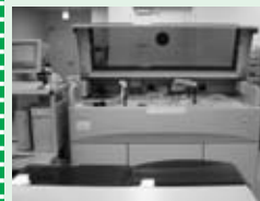
(生化学自動分析装置)

検体検査部門には、自動分析装置を設置し、生化学検査・血液検査・免疫検査・尿検査を実施しています。生化学自動分析装置・HbA1c測定装置・血液ガス分析装置を更新しました。生化学自動分析装置は、肝機能や腎機能など多数の項目を同時に測定できる装置です。HbA1c(ヘモグロビン・エイワンシー)測定装置は、過去1~2カ月間の血糖値の平均を測定し、糖尿病の診断にも使われます。血液ガス分析装置は、血液中の酸素分圧・二酸化炭素分圧・ヘモグロビン濃度が測定できます。